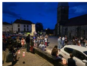
Retraite aux flambeaux 2024